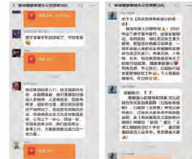
2020年这个庚子鼠年春节,必定会被铭记,连日来湖北武汉发生重大疫情,新型冠状病毒正在肆虐,并向全国蔓延,一场关系到人民群众生命健康的疫情防控战正在进行。

病毒无情,人有情,面对新型冠状病毒肆虐的严峻考验,中华民族一方有难八方支援的民族伟力再次得到淋漓尽致的展现。恒运集团在疫情面前勇担企业责任,以实际行动驰援武汉。疫情发生以来,恒运集团高度重视,按照党中央决策部署,按照天津市、滨海新区有关要求,把疫情防控工作当成最重要的工作来抓。第一时间启动防控机制,成立疫情防控指挥领导小组,研究制定防控措施,积极统计员工出行情况及返工情况,确保掌握所有员工,保证信息传递及时、准确。在做好自身疫情防控外,恒运集团感恩的企业文化理念在此时得以彰显,集团员工积极踊跃为支援武汉疫情捐款,截止目前,共收到79位员工的捐款,总额15800元,集团已完成向天津市慈善协会捐款总计15万元,用于支援武汉疫情防控和治疗疾病工作。