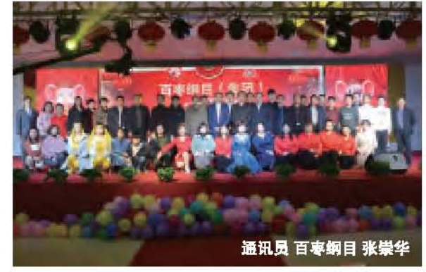
通讯员 百枣纲目 张崇华