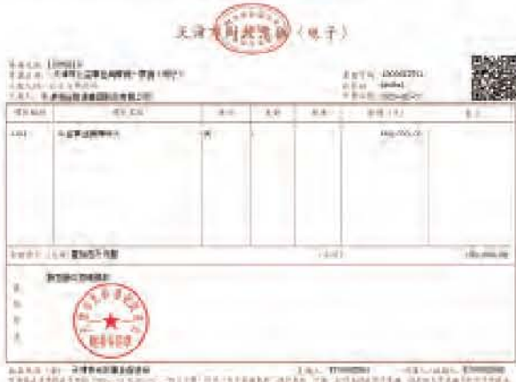
主动作为,不信谣,不传谣,服从天津市委市政府领导指挥安排,全力支持市政府做好疫情防控工作,与全国人民团结一心,用实际行动彰显企业的责任与担当,共同打赢这场疫情防控战!

疫情防控期间,恒运集团将坚定信心,凝心聚力,主动作为,不信谣,不传谣,服从天津市委市政府领导指挥安排,全力支持市政府做好疫情防控工作,与全国人民团结一心,用实际行动彰显企业的责任与担当,共同打赢这场疫情防控战!