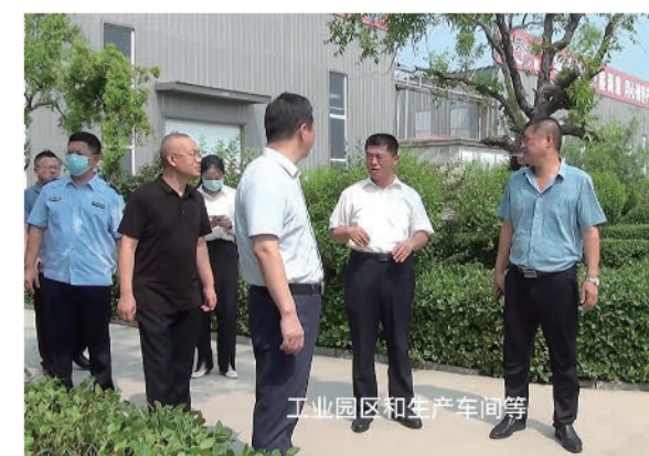
工业园区和生产车间等